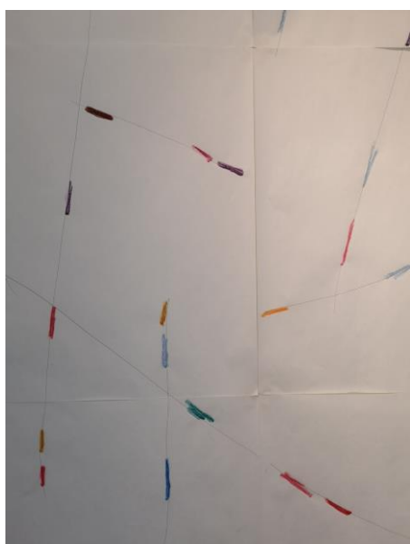
Détail de l'oeuvre