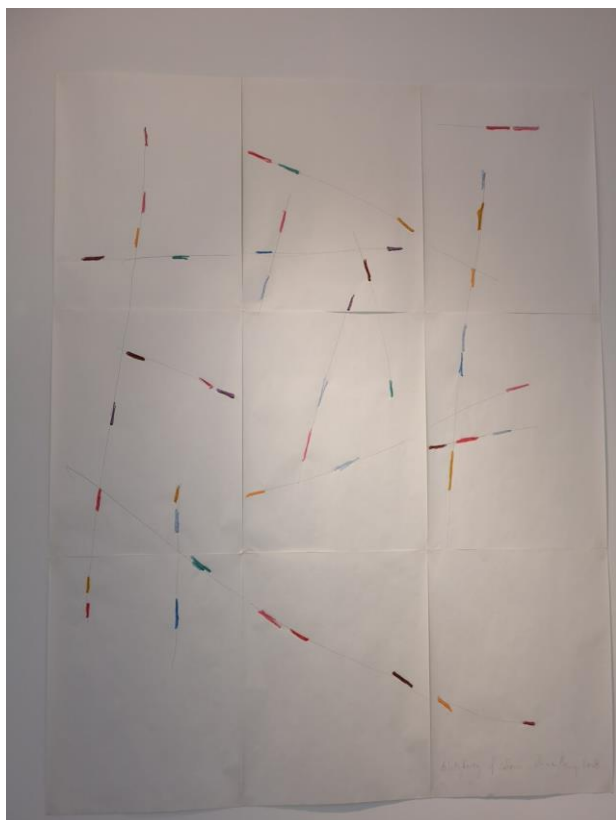
Vue sur l'oeuvre