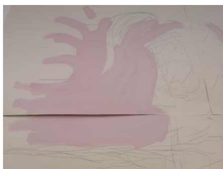
détail de l'oeuvre