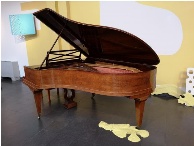
Détail de l'installation éphémère « Repeindre » (janvier 2020) avec vue sur la peinture murale, le trompe-l'œil créé avec le couvercle du piano et une des flaques de plâtre peintes installées au sol contre l'un des pieds du piano

installation éphémère créée in situ incluant des œuvres préexistantes, une peinture murale, un Tableau raté , des flaques de plâtre peintes et des objets